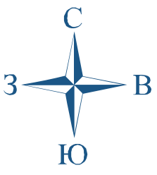
Схема автомобильных дорог (улиц) д. Куково