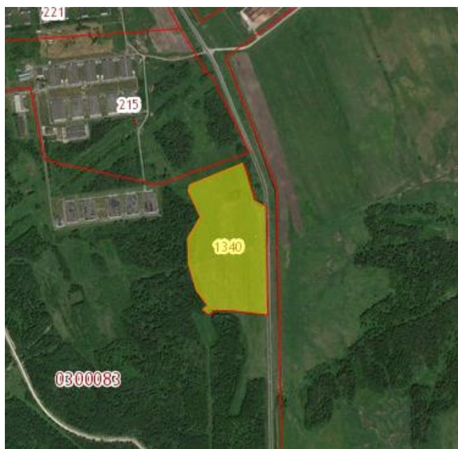
Рис. 1 Расположение участка проектирования на кадастровом плане территории

Обоснование: В соответствии с действующим на настоящее время градостроительным зонированием, земельный участок расположен в зоне С-1 - Зона земель, занятых сельскохозяйственными угодьями. Для зоны земель, занятых сельскохозяйственными угодьями в составе земель сельскохозяйственного назначения градостроительные регламенты согласно Градостроительного кодекса РФ не устанавливаются. В связи с этим выявлено явное несоответствие категории и разрешенного использования участка действующему градостроительному зонированию. Данное обстоятельство препятствует освоению земель для промышленных целей.