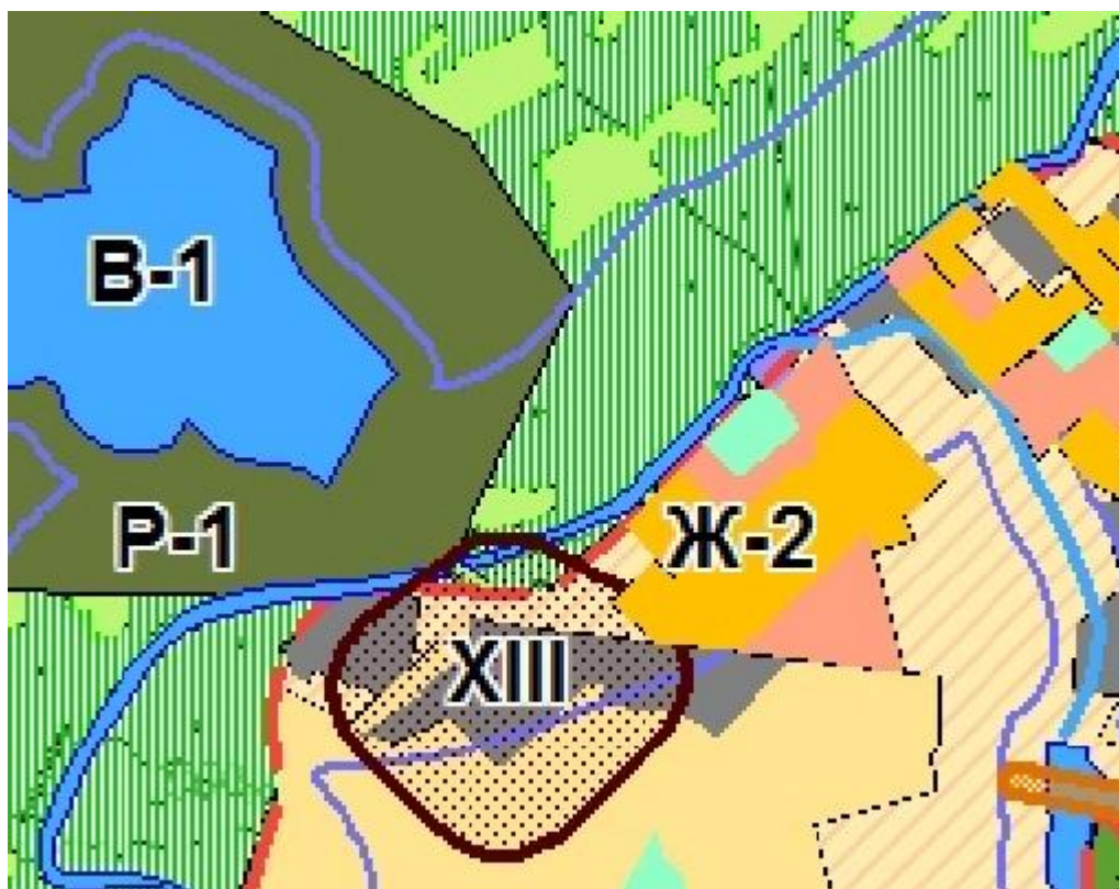
Рис. 2. Фрагмент карты градостроительного зонирования территории проектирования.

При проведении землеустроительных работ выяснилось, что участок располагается в нескольких территориальных зонах, хотя фактически расположен на свободной от застройки территории.