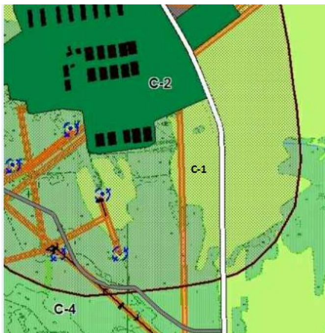
Рис. 2. Фрагмент карты градостроительного зонирования территории проектирования.

Территорию участка не возможно использовать без уточнения градостроительного зонирования. Участок с кадастровым номером 70:14:0300083:1340 предполагается использовать для размещения «Производственного комплекса по приемке, хранению и переработке масленичных и зерновых культур» в Томском районе Томской области. Категория земель участка – земли промышленности, транспорта, связи ... и иного специального назначения. Расположение его в зоне С-1 - Зона земель, занятых сельскохозяйственными угодьями, не возможно. В случае его использования для заявленных целей необходимо расположение участка в территориальной зоне П-1- Зона производственно-коммунальных объектов.