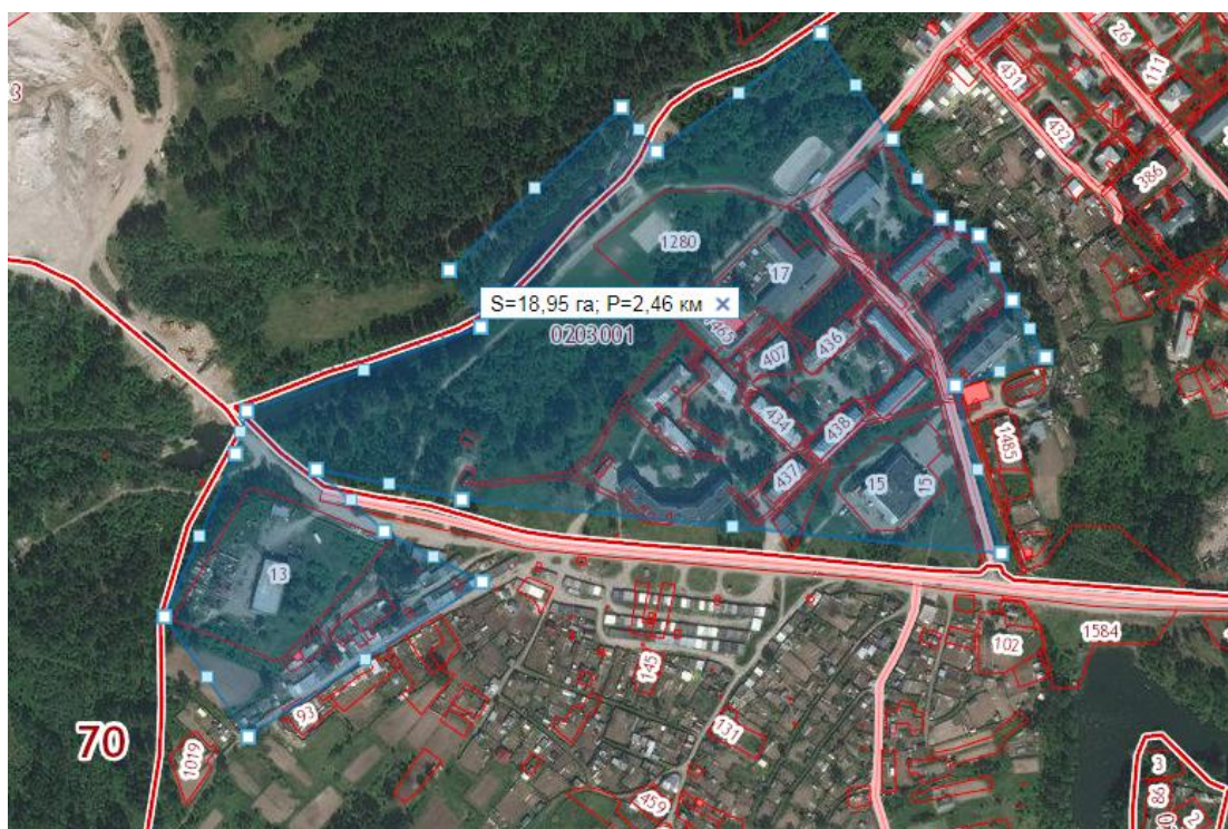
Рис. 3 Расположение участка проектирования на кадастровом плане территории п. Копылово

Площадь проектирования: ориентировочно 20 га.